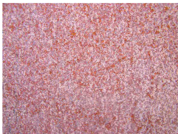
3 – 5 let expozice

Při vzhledovém hodnocení se ochranné vrstvy patiny převážně vyznačují tmavě hnědým zabarvením s přechodem do fialova, uzavřeným, kompaktním vzhledem povrchu vrstvy bez uvolňujících se částic a šupin, tloušťkou do 200 \mu\text{m} a jemnou makrostrukturou, částice jsou pevně zabudované do vrstvy (Obrázek 1).