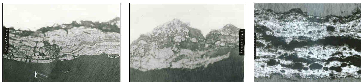
a) průmyslové prostředí, 8 let expozice, volná atmosféra b) průmyslové prostředí, 8 let expozice, přístřešková expozice c) městské prostředí, 20 let expozice, most, neochranná rez

Na metalografických výbrusech vrstev rzi lze velmi názorně dokumentovat rozdílnost stavby vrstvy při optimálních venkovních expozičních podmínkách (Obrázek 2a), při relativně příznivých podmínkách přístřeškových (Obrázek 2b) i stavbu vrstvy vznikající za nevhodných expozičních podmínek - v uvedeném příkladě na neudržované polozakryté horizontální ploše dolní pásnice mostu (Obrázek 2c).