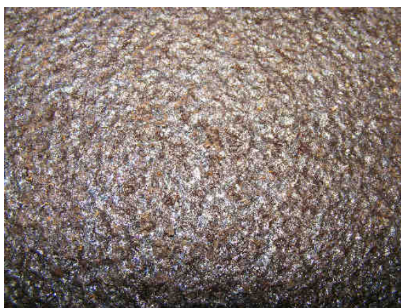
25 – 30 let expozice